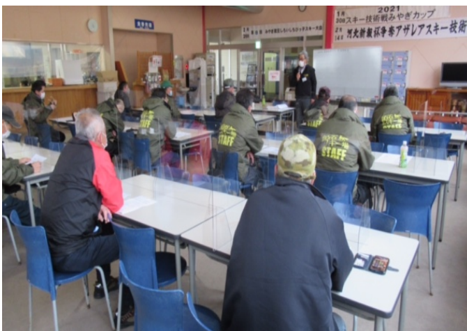
(索道研修会の様子)