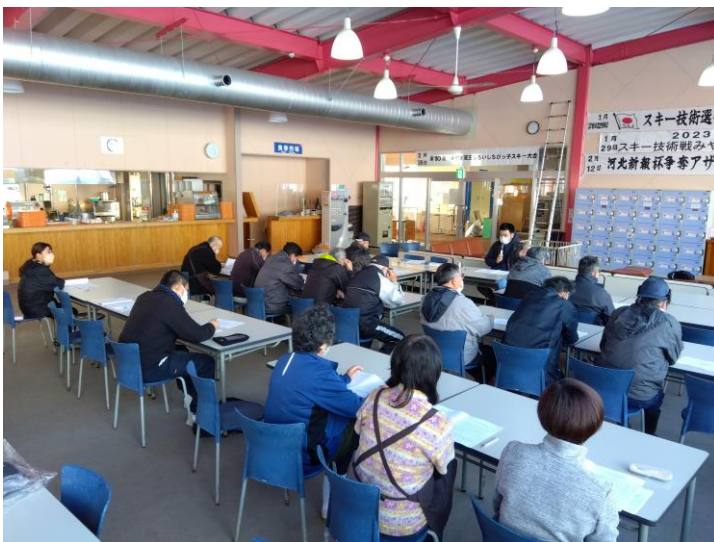
(索道研修会の様子)