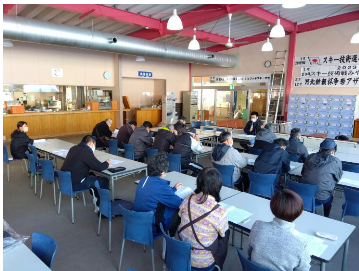
(索道研修会の様子)